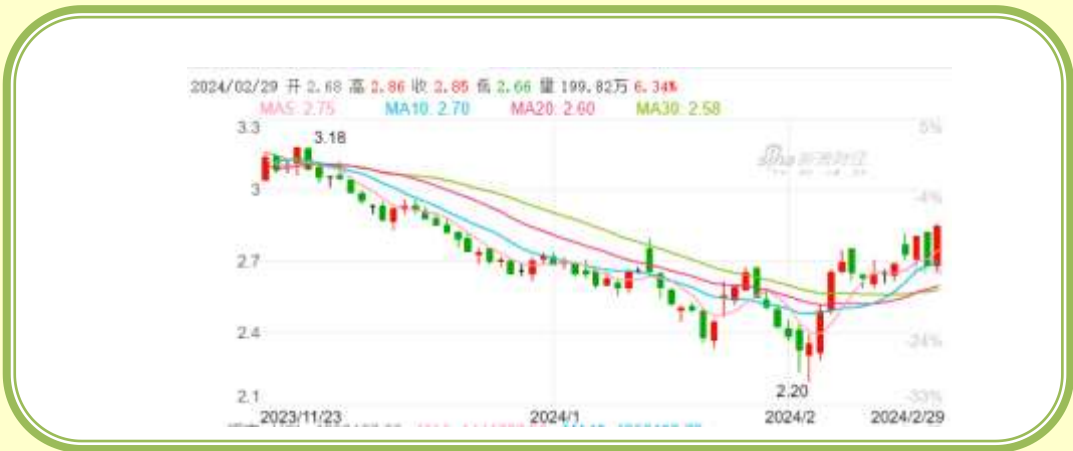
(福田汽车 K 线图，截至 2 月 29 日)