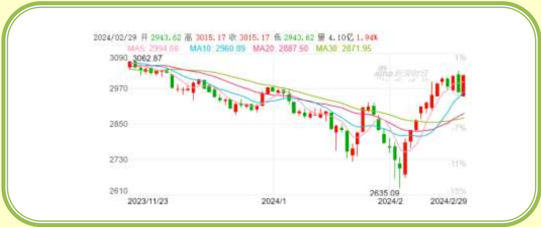
(上证指数 K 线图，截至 2 月 29 日)