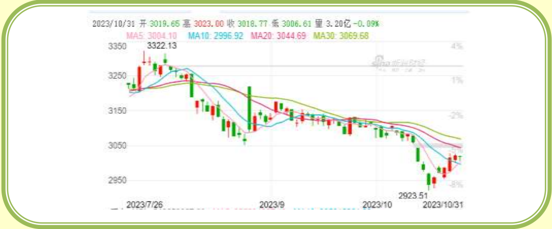
(上证指数 K 线图，截至 10 月 31 日)