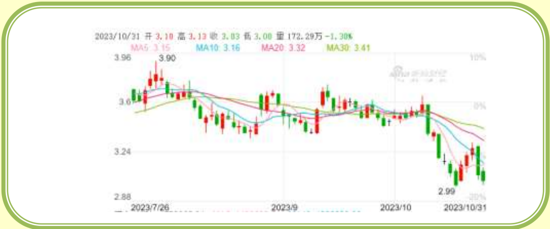
(福田汽车 K 线图，截至 10 月 31 日)