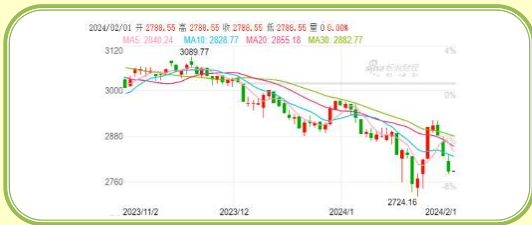
(上证指数 K 线图，截至 1 月 31 日)