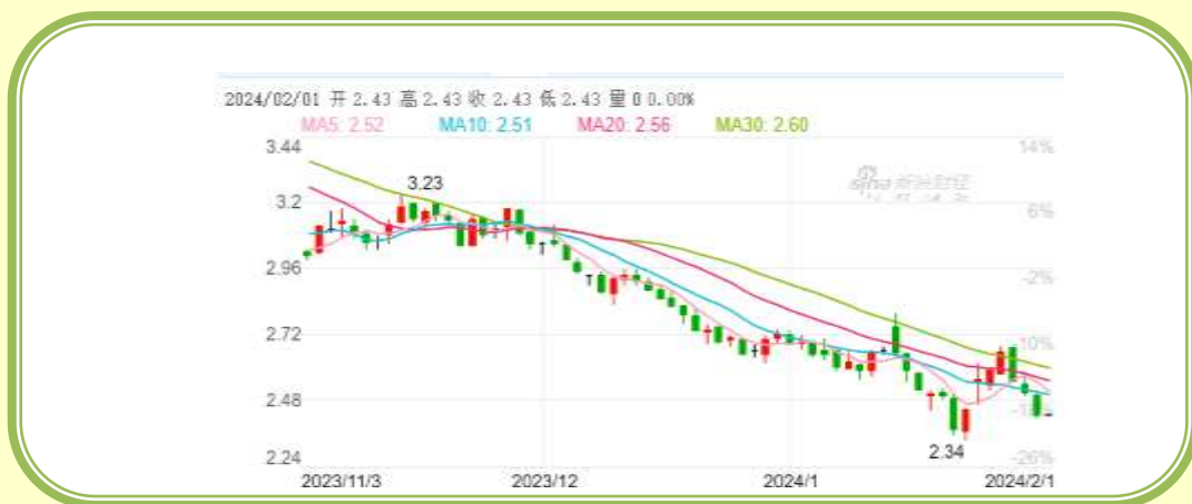
(福田汽车 K 线图，截至 1 月 31 日)